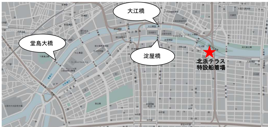
毎時潮位 大阪 2011年10月1日～2011年10月31日の潮位予測

http://www.jma.go.jp/jp/choi/graph.html?areaCode=&pointCode=156206